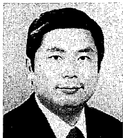
衆議院議員 中川 秀 直

I 間接税改革の趣旨——現行の我が国税制は昭和25年のシャープ勧告によってその基本が作られた。どんな制度でも年が経つにつれ経済社会の実情から徐々に乖離し或いは歪みが蓄積し抜本的改革が必要となる時期がくることは世の常である。現行の間接税にも次の如き問題点が指摘されている。